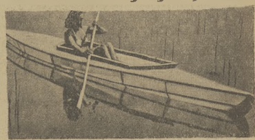
W szeregu krajów robione są próby wprowadzenia szklennego kajaka. Jest on przezroczysty, wykonany z winolu.