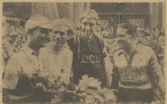
VIII „Tour de Pologne” został zakończony. Kolarze 9 narodów przejechali z górą 2000 km, walcząc zaciebie przez całą drogę, a równocześnie niosąc „Hasło Jedności i Pokoju”. Wyścig wygrał Włoch Locatelli. Pierwszym na ostatnim etapie w Warszawie był również Włoch — Spalazzi. Drużynowo wygrała Rumunia.

Szczegółowy opis ostatnich etapów i szczegółowe wyniki w relacjach naszych wysłanników znajdują Czytelnicy na str. 3 i 4.