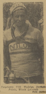
Zwycięzca VIII Wyścigu Dookoła Polski, Włoch Locatelli.

pięciu rzeczoznawców, obznajomionych z poszczególnymi dziedzinami zagadnień turystycznych. Powołanie Rady Turystyki, ma dla całego kraju zagadnień, turystycznych znaczenie przełomowe. Całość turystyki masowej znajduje w tym wreszcie właściwego opiekuna i inicjatora. Zgodnie z programem naszego piśmi, niezasklepiającym się jedynie do zagadnień wąskiego odłamku sportu wycieczkowego, ale sięgającym do wszystkich dziedzin wychowania fizycznego, stało wyświadło do tak potrzebnych, jakimi są wczesny pracownice oraz turystyka, będzie naszym czytelników stale informowała o działalności nowopowołanej do życia Rady Turystyki, jak i wszelkich przejawach ruchu turystycznego.