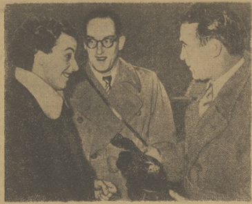
Karel Čechov, sławny boxer (wzrost 1,80 m, waga 100 kg) — jeden z najlepszych zawodników w historii. W tym roku w Moskwie zdobył złoty medal. W tym roku w Moskwie zdobył złoty medal. W tym roku w Moskwie zdobył złoty medal.