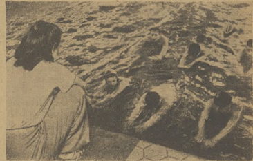
Krytyka basen pływaków „Torpeda“ należy do najlepszych w Moskwie. Na str. 3 przybliżamy opis pracy sportowców na basenie.