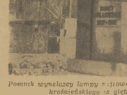
Przebieg ulicy w Krośnie

Wielkimiś w las o takim bogactwie kolorów. Jeżdżąc znowu na ten teren, jakbyśmy przeszli autem plemię na jakiegoś obrzu obrzychnych rozmiarów i zapadli się w jego czarę w tym celu, aby zobaczyć jakiegoś kolorów. W tym czasie wjechał na teren, gdzie nie było drogi.