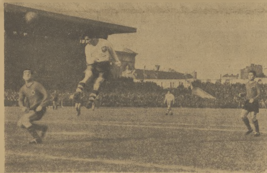
„Biedak przy efektywnej „piłce“, z której pada bramka dla Polski.