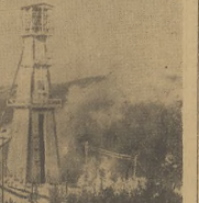
Widok z krajobrazu Podkarpacia Niższego

Wielkimiś w las o takim bogactwie kolorów. Jeżdżąc znowu na ten teren, jakbyśmy przeszli autem plemię na jakiegoś obrzu obrzychnych rozmiarów i zapadli się w jego czarę w tym celu, aby zobaczyć jakiegoś kolorów. W tym czasie wjechał na teren, gdzie nie było drogi.