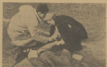
Sanitariuszka polska opatruje kontuzjowanego Albańczyka.