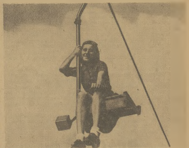
Tak podróżuje się stycielem krzesłowym. Przyjemnie i bezpiecznie! Patrz artykuł o kolejkach i wycieczkach innych w Polsce na str. 3.