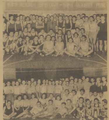
W 18 miejscowościach Śląska odbył się turniej szachowy i koszykarski dla kół sportowych przy zakładach pracy. Bierze w nim udział 410 drużyn. Na górnym zdjęciu uczestnicy turnieju w Zabrze, poniżej w Chorzowie.