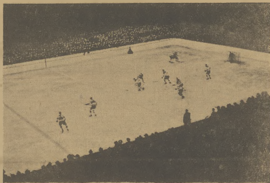
Opólny widok złącznego lodowiska w Katowicach podczas pierwszego tegorocznego meczu pomiędzy Śląskiem a Krakowem