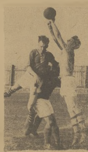
Przebieg meczu piłkarskiego I Ligi pomiędzy Górnikami Radlin, a warszawskim Kolejarzem Polonią, zakończony wynikiem nierozstrzygniętym 1:1.