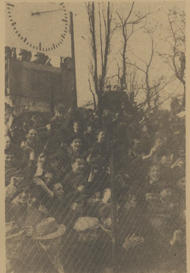
Przed sekundą padła bramka dla Górnika Radlin w meczu z Polonią. Nikt chyba nie powie, że kibice Górnika są tym jakimś zaszczytem...