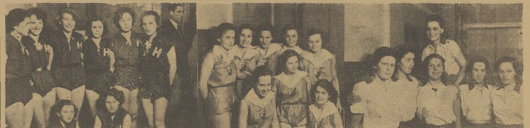
W Warszawie odbył się turniej w lokach gimnastycznych o mistrzostwo szkół średnich. Na zdjęciu z lewej — zwycięski zespół gimn. im. Hojmanowej, w środku — drużyna wojskowa zmaszczony w dodatku „Szkoła ma głos” na str. 5.