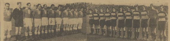
Ledziński Włókniarz zmasakrał plezanów, własnym spotkaniem ligowym w Warszawie, gdzie uległ Legii 1:2. Na zdjęciu z lewej — drużyna łódzka, z prawej — zespół warszawski.