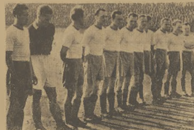
Na zdjęciu z lewej — zespół Budowlanych AKS, z prawej — zwycięska drużyna Gwardii.