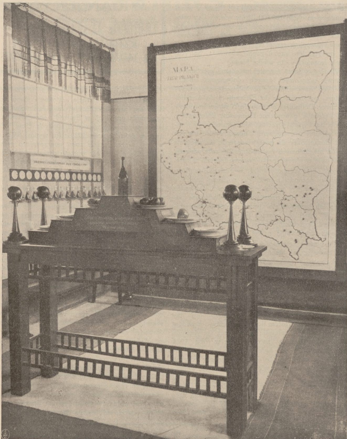
FRAGMENT WNĘTRZA PAWILONU „PIWOWARSTWO i SŁODOWNICTWO” NA P. W. K.