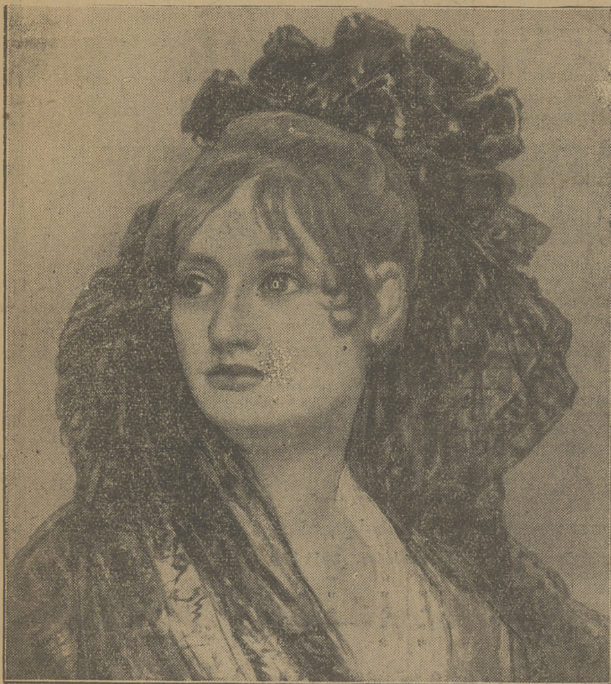
Piękna Andaluzyjka, obraz Franciszka Goi (1746-1826), sławnego malarza hiszpańskiego