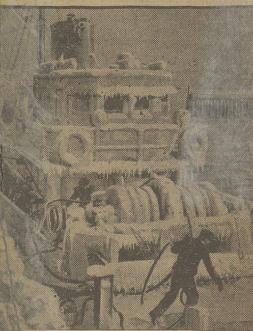
Okreć po podróży w grudniu.