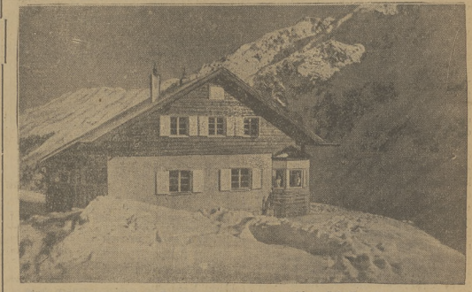
Schronisko narciarskie w Tyrolu na szczyt życia alpejskim „Schafkogel” (2820 m.).