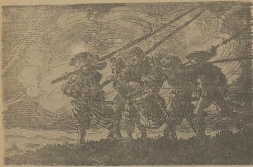
Piechota zaciężna polska z 14 i 15 wieku.