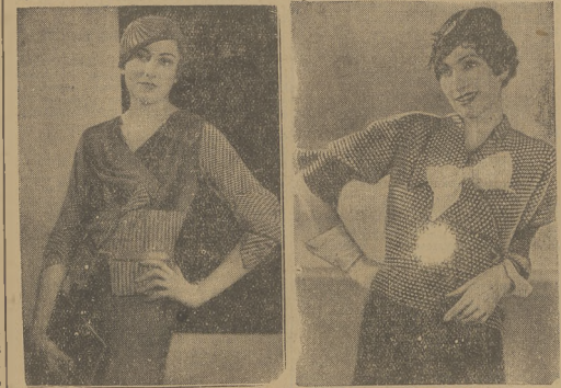
bliski wzrocznie z odnowieniami kapietkami