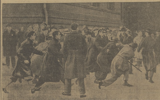
Just rząca normalna, że w wszystkich uniwersytetach od czasu do czasu dochodzi do awantur, w których wywołuje się gorący temperament młodzieży. Do takich awantur między hitlerowcami a republikanami doszło na uniwersytecie w Berlinie, gdzie połała się krew, a niewiele pomogła interwencja policji.

prowadzone nadal przez 1198 Dr. B. CZARSKIEGO zostało przeniesione na ul. Teatrlną 1 oficyna parter naprotw bramy, Tel. 26