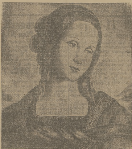
SLAWNE PORTRETY KOBIEC. Piotr. Vanuzzi Perugino (1846-1925), mistrz szkoły umbryjskiej, którego freski zdobią kaplicę Sykstyjską; „Portret młodej pani”.