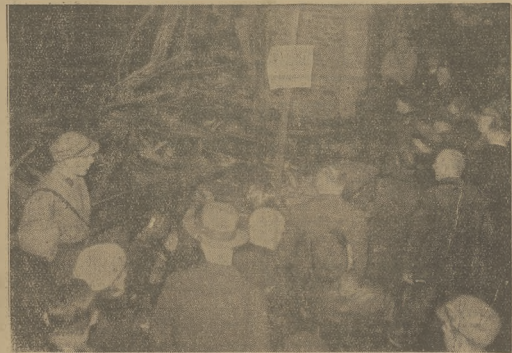
Spaloną salę Reichstagu oglądają tłumy berlińczyków.

BERLIN, 7.5. Z Damstadtu donoszą: Ubiegłej nocy nastąpiło objęcie władzy policyjnej przez mianowanego z polecenia ministra spraw wewnętrznych komisarza Rzeszy Ad. Hesja. Narodowo - socjalistyczne oddziały szturmowe i formacje ochronne obdyskiły gmach policji. Policja wydała całą broń, nie stawiając oporu.