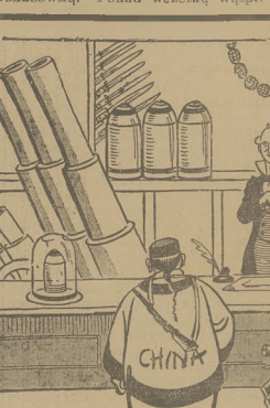
ZAMLOWANA POKOJOWA A HANDEL.

Ostatnie wybory są na zegarze dziejowym Niemiec niepokojąca wskazowka. Ponad wszelką wątpli-