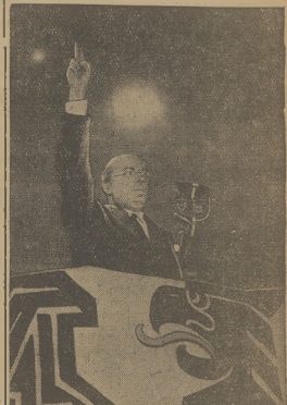
Ten, który przeszedł być jerykiem w wari, przewódca niemieckich centrów, h. kanclerz Brüning.

Bank Polski rozpoczął kupowanie dolara, placąc kurs 8.60.