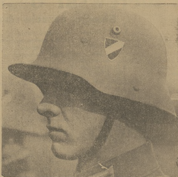
ZMIANA OBlicZA... KOLOROWYCH NIEMIEC.

Zarządzeniem prezydenta Rzeczy niemieckiej na hełmach armii niemieckiej barwa republikańska „czarno-białoczerwona” przemalowana została na cesarską barwę „czarno-białoczerwoną”. Na lewo, żołnierz w pospisanym tempie przemalowywujący na pułku barwy na hełmach. Na lewo, żołnierz w barwach cesarskich.