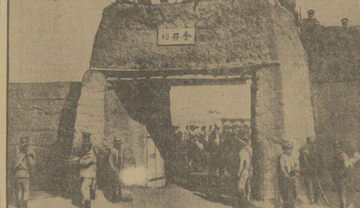
WALKA O JEHOŁ.