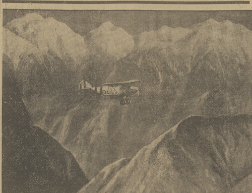
LOT NAD MOUNT EVEREST.

gdz stosunki sowiecko - niemieckie stanęły na osiru, może, jest rzeczą bardzo wątpliwą. Tembardziej nierozumiałą wydaje się taktyka G.P.U. drażnienia Anglii przez uwieszenie jej obywateli.