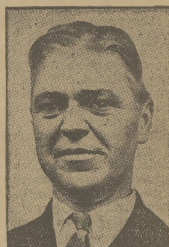
Pierwszy pilot załogi „Acronu”, który znajdował się na pokładzie „Acronu” i zginął w katastrofie.