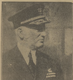
Admirał Mossel, szef floty powietrznej Stanów Zjednoczonych, który pilotował sterowiec w katastrofie „Acronu”, na którym się znajdował.