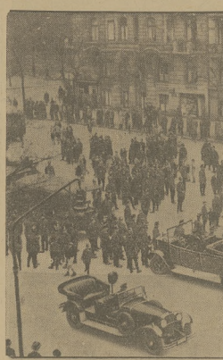
REWIZJA W KOMUNISTYCZNYM DZIELNICY HAMBURGA. Policia i oddziały hitlerowskich bojówek przeprowadziły gruntowną rewizję w hamburskiej dzielnicy robotniczej 4. zw. Gansweide, jak widac na ilustracji w detalach tej skoncentrowano w czasie rewizji olbrzymią ilość policy.