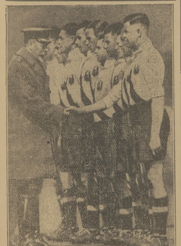
Król angielski Jerzy W. Wila stał z członkami Armiiy polarskiej Helana z pułkiem Wielkiej Brytany.

Użyłoby to jakos to wszystko, na granice łowarskich.