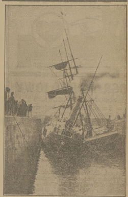
Pod Glanowia we Francji zdarzył się w śluzie kanału dwa ataki „Augustin Fresnel” i „Theresa”.