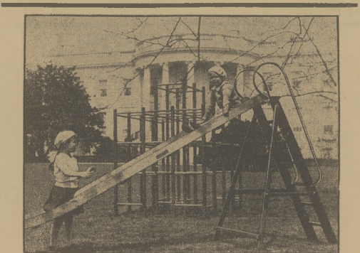
JAZDA Z GORY NA DOL. Przed Białym Domem w Waszyngtonie, siedzibą prezydenta Stanów Zjednoczonych Roosevelta, gdzie się rozgrywał jedy dolar.

Jak widzimy i jedna i druga strona ma o co walczyć. Rezultaty tej walki mogą wszakże w końcu zainteresować i stronę trzecią, miano że ta zajęta jest w tej chwili bliższymi, ekonomicznymi kłopotami.