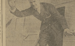
Pa skończonici podziary sączymianem.

Z DZIAŁU OGŁOSZENI. W dziale ogłoszeń prawego piśmie... z tym następujące treści: ogłoszenia... Proszę go odebrać! Dzień poźniej: „Nie znam chemików... Należałbyż być: „Od dziesięciu lat... ma się sobie”.