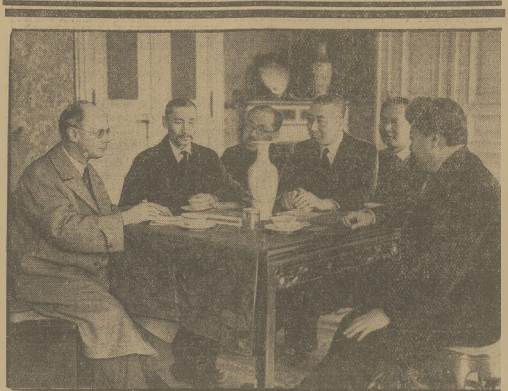
CHENSKI GEN. MA W PRZEJĘDZIE PRZEZ POLSKĘ. Przew. Warszol przejechał niedzład wyposażony przez Sowiel dołwiedca araji chińskiej w Mandarji gen. Ma, który po walce z armiją japońską wycofał się na terca sowieckiej i był internowany. Gen. Ma (drugi z lewej strony) z granadką oficerow chińskich, którzy dzieła jego los.

daje pewien zameł. Niektóre papiery procentowe, opiewają na dolary. Banki i kas oszczędności mają wkłady i wierzności dolarowe. Niektóre instytucje finansowe jak naprzykład kasy oszczędności, mają tył kredytyw i wkłady dolarowych bardzo dużo. Naprzykład w młotopolskich komunalitych kas oszczędności na 270 milionow zł. wkładów, przypada 125 milionow zł. wkładów dolarowych bardzo dużo. Naprzy-