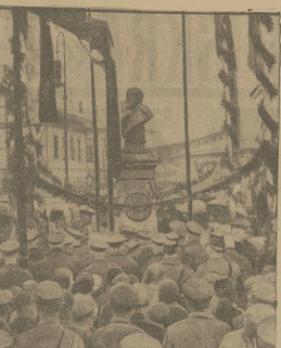
Uroczystość powitania odświeżona pomnika cesarza Wilhelma w Berlinie, który w r. 1918 został usunięty.

Uproszczyło zaparcie sielca, kataru grubego jelit, zaskę w kichkach, wzdęcie, ból w bokach, przedcho przy użyciu rano i wieczór po składowce naturalnej wody guralki „Franciszka-Józefa”. Ządać w apt. 2273