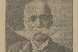
Znany japoński generał Nagata, który pozbawił włoskie zasługi na polu lotnictwa, wspaniale i nie miał równych sobie nader popularny m. in. w powołał obywateli wspanię, jednak w Japonii nie widzi się.

tolickie agraryjny uzyskało 2325, rudykalowie byłego ministra Leroux (94), socjaliści 157, rudykalowie socjaliści 1276, konserwatyści 1113 i akcja republikańska 112. Rezultat wyborów wywołał przygnębienie w madyryckich kołach rządowych, które są zaniepokojone wielkim wzrostem stronnictwa prawicowych. Krąg uparczości położył, że rząd premiera Azary podda się do dymisji.