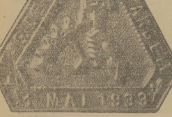
Hilferowski, znak pracy", wybitny na dzień 1 maja.

Dziesięć bieg naprzędlą o amatorszowo Polski puchar na dystansie 1200 metrów wygrała Nowacka z warszawskiego W.Z. w czasie 5:07. Druga swiędska (AZS Poznań) — 5:12. Startowało 17 zawodniczek. Bieg odbył się w Łodzi.