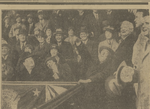
PRZY WAŻNYM „AKCIE PAŃSTWOWYM”.

LONDYN. 25. Rząd kanadyjski ogłosił oficjalnie, iż porzucił paritetu dolar kanadyjski. Dolar kanadyjski jest ściśle związany z amerykańskim i decyzyjnie powziął obniżenie. Jest niewątpliwie następstwem decyzji prezydenta Roosevelta. Zaznaczyć należy, że gdy Wielka Brytania we wrześniu 1931 r. odstąpiła od paritetu złota, Kanada odmówiła zadanu Londynu pójścia za jego przykładem. Obecnie czyni to bez ządania Waszyngtonu z własnej inicjatywy, co świadczy o ścisłym związku gospodarczym pomiędzy Kanadą a Stanami Zjednoczonymi. Decyzja władz kanadyjskich jest poważnym ciosem dla polityki kładowi Ottawskich.