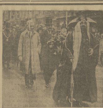
EGZOTYCZYNY WIELBIELCIELE ZSEKSFARU