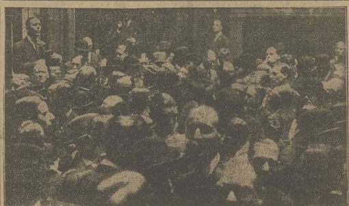
Na giełdzie londyńskiej wobec załki dolaru.

LONDYN, 28.4. Kalkiny donoszą, że ekspedycja angielska, która dokonała dwudziestego lotu nad szczytem Mount Everest, wakułce obfitych opadów śnieżnych, uwięziona jest w swoim obwozie w dolinie Rongbuk. Wszelkie połączenia z doliną są przerwane. Członkowie ekspedycji komunikują się z światem za pomocą zapoczątkowanego depeza skrowych.