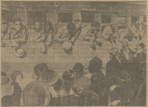
Bohaterzy żołnierze udają się na front przeciw Paragwajowi.