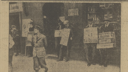
GDAŃSK W DNIU WYBORÓW NIEDELNIEJCH. U góry: Ulica miasta upstrzona afiszami hitlerowskimi. Niżej: niemieckie i polskie afisze wyborcze przed jednym z lokali wyborczych.