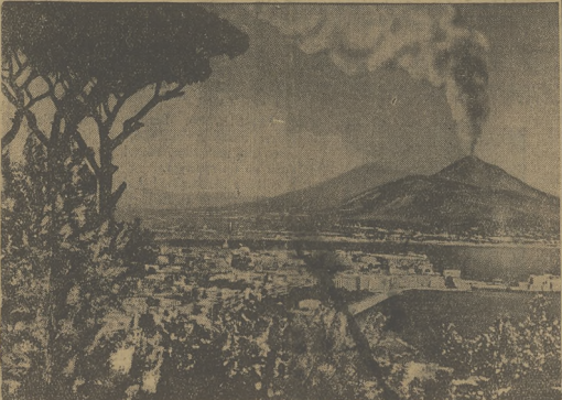
Najpiękniejsze widoki świata: Zatoką Neapolitańską na dno Wezuwiusza.

NEAPOL, 7.6. Działalność Wezuwiusza wymaga się stałe w ciągu ostatnich kilku dni. Poza normalnym deszczem popiołu, dobywającym się z głównego krateru, wulkan przejawia swą działalność w tworzeniu nowych wyłotów, z których jeden o średnicy 20 metrów bucha stałe dymem o zapachu siarki i wyrzuca od czasu do czasu rozpalone do czerwoności kamienie. W pobliżu zachodniego krateru utworzyły się fontanny lawy, tworzące potok, posuwający się z szybkością 10 m. na minutę tuż przy otworze.