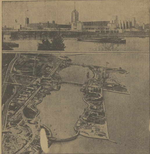
Z WYSTAWY W CHICAGO. U góry: hala wycieczki nad brzegiem jeziora Michigan. Niżej: plac wystawowy z lotu ptaka.

WILLA HELA w Kąkolowie nad Pilicą, poleca pokój z urozmaienionym widokiem, kuchnia, wspaniałe otoczenie. Ceny niskie. 3800