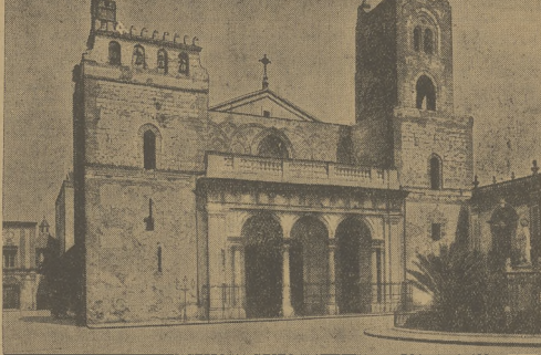
Katedra Palermo, której styl łączy w sobie motywy normanńskie z romańskimi.

× WARIUNKI EKSPORTU DO GRECJI. Według informacji delegata Państwowego Instytutu Eksploatacyjnego w Atenach, przyjazd dewiz do Grecji dokonywany jest w ramach gwarantowanej importacji kłopotliwych przywózów, ponieważ zasada ta odnosi się