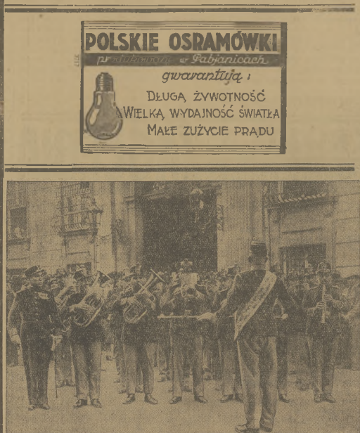
POWROT DAWNYCH MUNDURÓW AUSTRIACKICH.

Całe to lotnictwo cywilne jest pod znakami służby wojskowej i przygotowane do niej w każdej chwili.