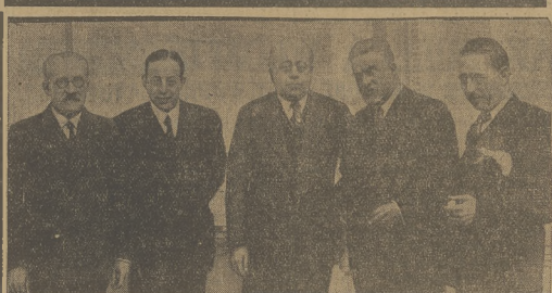
NOWY GABINET HISZPAŃSKI.

Najwidoczniej zadaniem konferencji wszechświatowej — píše dziennik — ma być umożliwienie Hitlerowi i jego zwolennikom osiedlenia się niemieckich kolonistów na obszarze Polski, państw bałtyckich, Rosji i w ogóle wschodniej Europy. Memoriał będzie rozrysował praktykowany przez konferencję, jak na to zasługuje. Co Niemcy wówczas uczynią, niewiadomo, lecz rząd, który może produkować tego rodzaju memoriał, jest zdolny do każdego warjatwa, koiczy „Daily Herald“.