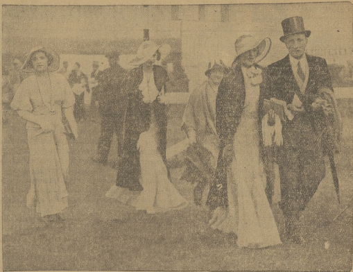
Największym zarłaczem zryła towarzyszywni w Anglii są w obecnym sezonie wyścigi w Ascot. Przygląda się im elita towarzyszywni angielska z królową królową i królową widać na lewej ilustracji w momencie, gdy do mety przybiegają konie „Roi de Paris” i „Dietum”. Na ilustracji po prawej stronie publiczność wyszycowa z kol angielskiej arystokracji, ubrana według najnowszej mody