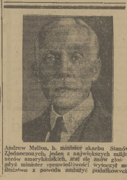
Andrew Mellon, b. minister skarbu Stanów Zjednoczonych, jeden z największych milionerów amerykańskich, był się znów zdecydował minister sprawiedliwości wycofać się z rządów z powodu nadużyć podatkowych

W obawie przed przeniesieniem się choroby na inne miejscowości miasto Alore zostało otoczone posterunkami policji, które wstrzymania wszelkiej z nim komunikacji. Jak słychać, na teren objawy epidemii wybiera się eskaperycja lekarzy.