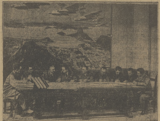
Przed wyłotem eskadry włoskiej do Chiego minister Balbo odbył konferencję z jej dowódcami w sali, ozdobionej obrazami obrażone, przedstawiającymi pierwszą wyprawę eskadry włoskiej do Rio de Janeiro.

„Echo de Paris" wymienia, jako najpoważniejszych kandydatów na ambasadora w Rzymie obecnego ambasadora w Warszawie Laroche i senatora Rene Bernard, który już opracował swego czasu funkcje ambasadora w Rzymie.