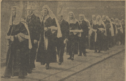
W MYŚL STARYCH TRADYCYI. Setkiowie angielscy, ubrani w starsowiejskie toggi...