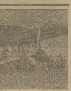
Wojenna marynarka angielska otrzymała nowy aparat lotniczy dla rzucania bomb typu „Hayford” o szybkości 225 km. i godzinie.

kon. kłamałszy, w krótkim czasie tak się opamiętał, że całkowicie wysunął się z pod wody człowieka. W roku 1926 opomawiał zachlannie kaktus 240 tys. km. kwadratowych. W n. zb. niedzielną odbył się w Katowicach, w kościele ad. konsekrowanej poświęconej na S. J. katechizm.