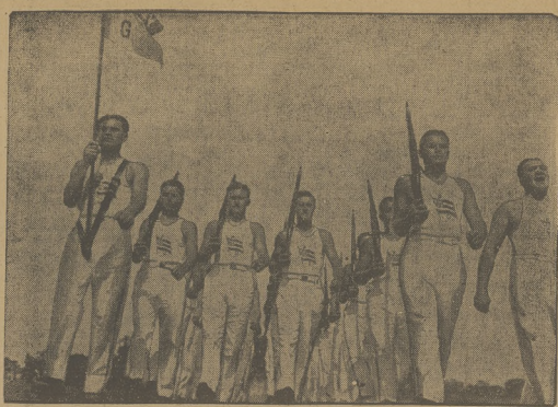
Gdy żołnierze amerykańskiego dokonyują upływu...