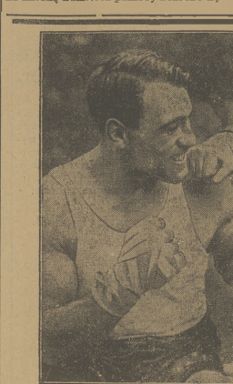
Pięć w zęby