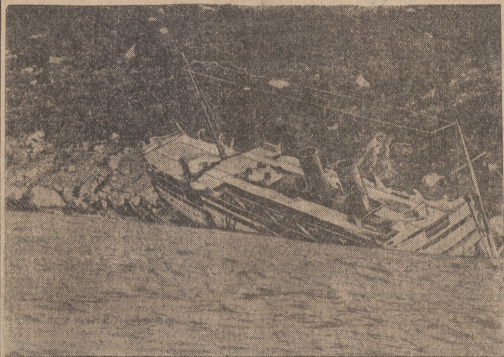
Francuski parowiec „Nicolas-Paqueet“ rozbił się przed kilkunastoma dniami w pobliżu Tangeru. Śledztwo w sprawie katastrofy z parowcem „Nicolas Paqueet“, który zatonił na skalach opodal Tangeru, ustaliło, że latarnia morska w Spartel działała wadliwie. Światło było niedość jaskrawe, a personel nie stał na wysokości zadania. Zatopiony okręt należał do nowoczesnych jednostek francuskiej floty pasażerskiej i utrzymywał łączność między Marsylią a portami Afryki Północnej.

WARSZAWA, 13.7. (Tel. wł.) Deficyt budżetowy za czerwiec wyniesie około 18 milj. zł.