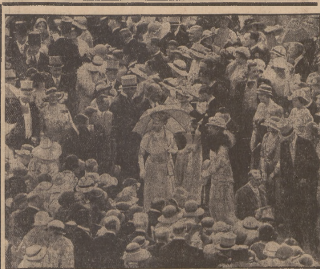
GARDEN - PARTY U KRÓLA ANGIELSKIEGO.

we kary, aż do kary śmierci włącznie, za akty buntu i terronu. Najbliższa przyszłość okaże, czy Goering, który już kilkakrotnie dowiódł, że potrafi żelazną pięścią tłumić wszelkie zarodki knowań rewolucyjnych, da sobie w pełni radę z wojną podjazdową, prowadzoną na terenie Rzeszy niemieckiej przez trzecią międzynarodówkę.