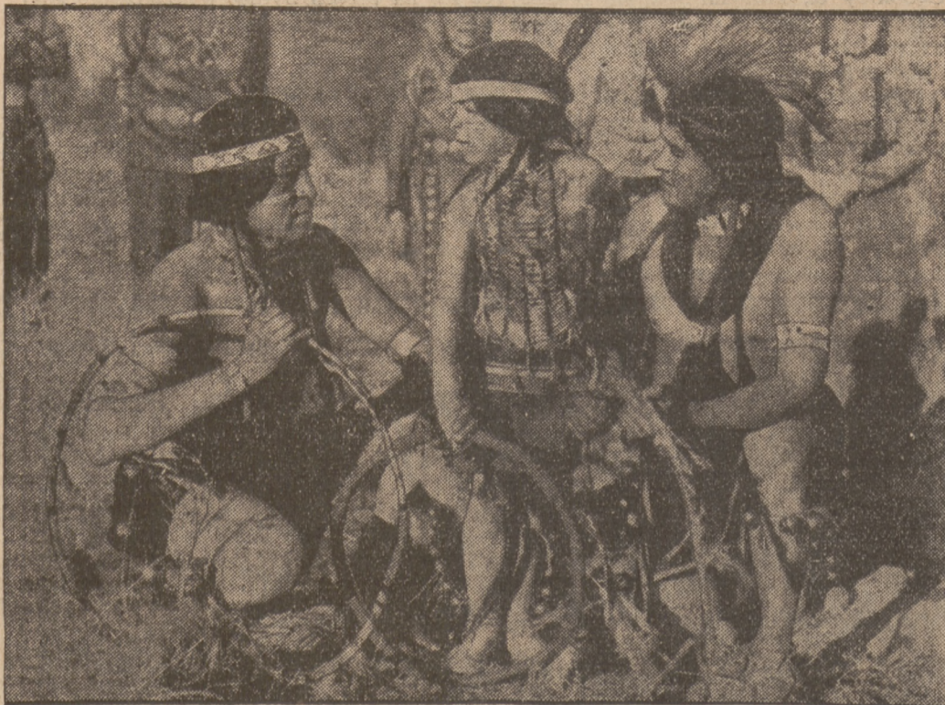
Ekzotyczny obrazek z życia nielicznych już szczepów indyjskich (koło Palmsprings (Kalifornia)). Na ilustracji fragment ceremonii podawania 5-letniego indyjanina próbie ognia i tkwi.

Jordanów — koło Rabki, wśród lasów, mieszkanie i wikt b. dobry jednej osoby wynosi od zł. 2.50 do 3.50. Wyczerpanym pracą umysłową, rekonwalescentom i dzieciom od lat 8 zapewniam prawdziwie rodzicielską opiekę. 4773