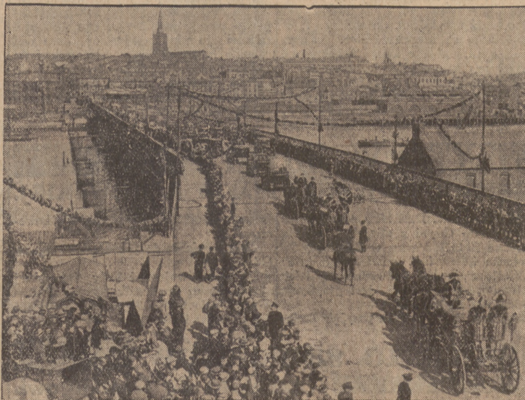
Podobnie jak w Londynie, wybór lord mayor w Londonderry (Irlandja) odbywa się z wielką paradą w tradycyjnych, historycznych strojach. Na ilustracji widok całego orszaku przejeżdżającego nowy most.