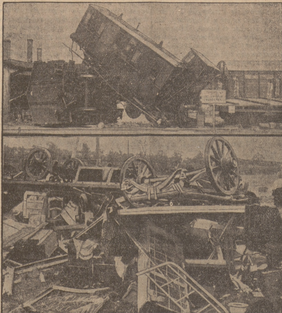
Po przejściu strasznego orkanu przez miasto Pürna w Salksonji.

zdolna ekspedientka z praktyką do wędliniarni. Sosnowiec Warszawska 14 — Koss. 5043