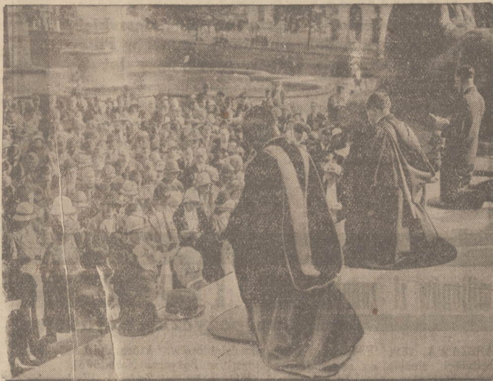
Na placu Trafalgar w Londynie odprawiono publiczne nabożeństwo, nakazane w całym kraju przez kościół anglikański, o uwolnienie świata od zawiści i socjalnych niepokojów

między cenami środków żywności na wsi a w naszym ośrodku, nie mówiąc już o tem, że i rolnik zyskałby skutkiem pozbycia się opieki pośrednika. Trudno się spodziewać, aby władze kolejowe wprowadziły z własnej inicjatywy tego rodzaju udogodnienie to też byłoby rzeczą wskazaną, aby sprawą tą zajęła się któraś z instytucyj gospodarczych i podjęła u władz kolejowych stosowne zabiegi w kierunku przeprowadzenia tak poręcznego ułatwienia dla szerokich warstw ludności.