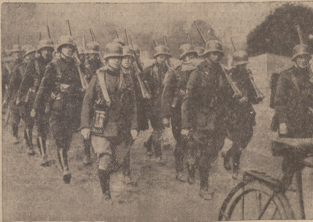
W okolicy Dublina odbyły się pierwsze manewry młodej armji irlandzkiej. Na rycinie widzimy oddział irlandzkiej piechoty w pełnym uzbrojeniu.