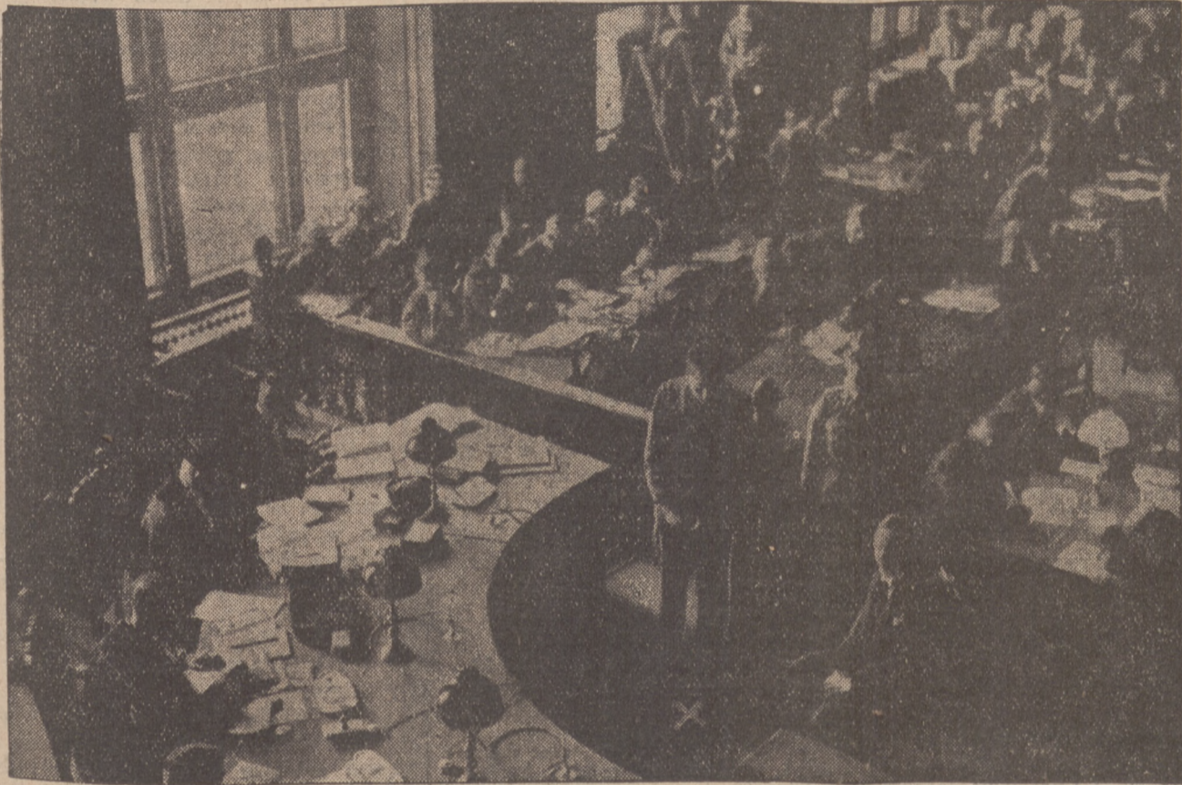
Ilustracja nasza przedstawia pierwsze chwile procesu lipskiego. Przed sądem stoi van der Lubbe(x), obok niego siedzi jego obrońca.

BERLIN, 22.9. Prasa berlińska obszernie omawia przebieg pierwszego dnia procesu w Lipsku. Korespondenci dzienników poświęcają uwagi swe charakterystyce głównego oskarżonego van der Lubbe, podkreślając, że zachowanie się jego nie potwierdza zgoda przypuszczeń, jakoby miało się tu do czynienia z chorym umysłowo.