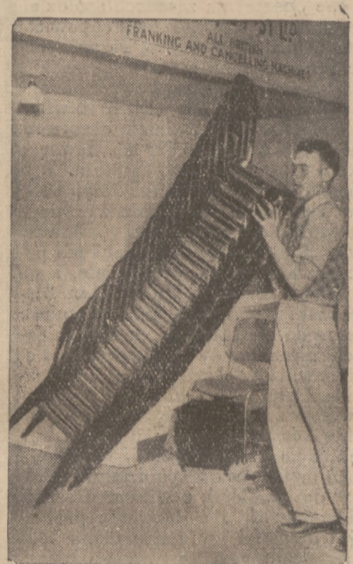
20 KRZESEŁ RAZEM. Na londyńskiej wystawie urządzeń biurowych pokazano m. in. komplet 20 krzeseł, które łatwo można zesunąć w jedną całość, co ułatwia ich przenoszenie, zwłaszcza, że są bardzo lekkie.