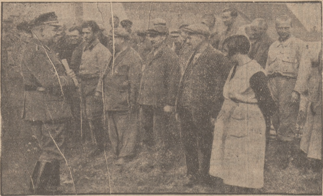
Raport w hitlerowskim obozie koncentracyjnym dla żebraków i włóczęgów w Meseritz.