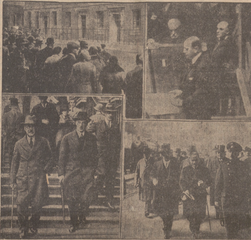
PO WYSTĄPIENIU NIEMIEC Z LIGI NARODÓW.

mane, kwalifikowane jest w Genewie jako właśnie najlepszy dowód, iż Niemcy nie zasługują na wiarę i zaufanie.