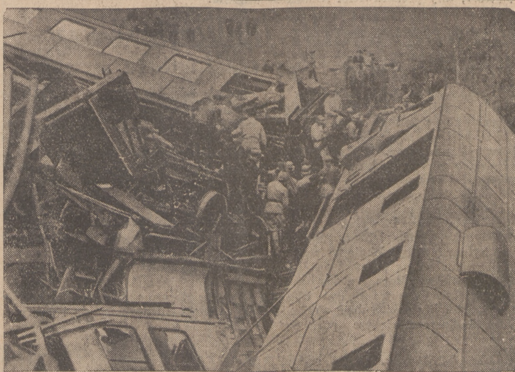
OLBRZYMLA KATASTROFA KOLEJOWA WE FRANCJI.

premjerostwo i sprawy zagraniczne — wojsko, Chauteemps — sprawy wewnętrzne, Bonnet — skarb. Inne teki rodów i sprawiedliwość, Daladier — jak w gabinecie Daladiera.