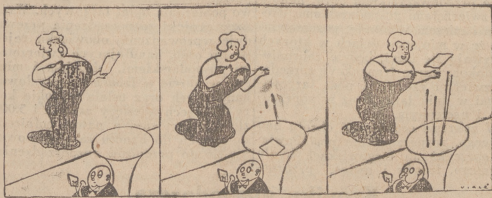
KRÓTKA HISTORIA BEZ SŁÓW.

Inspektorat pracy sporządził protokół o stosunkach, panujących w fabryce i zastosuje odpowiednie represje wobec właścicieli.