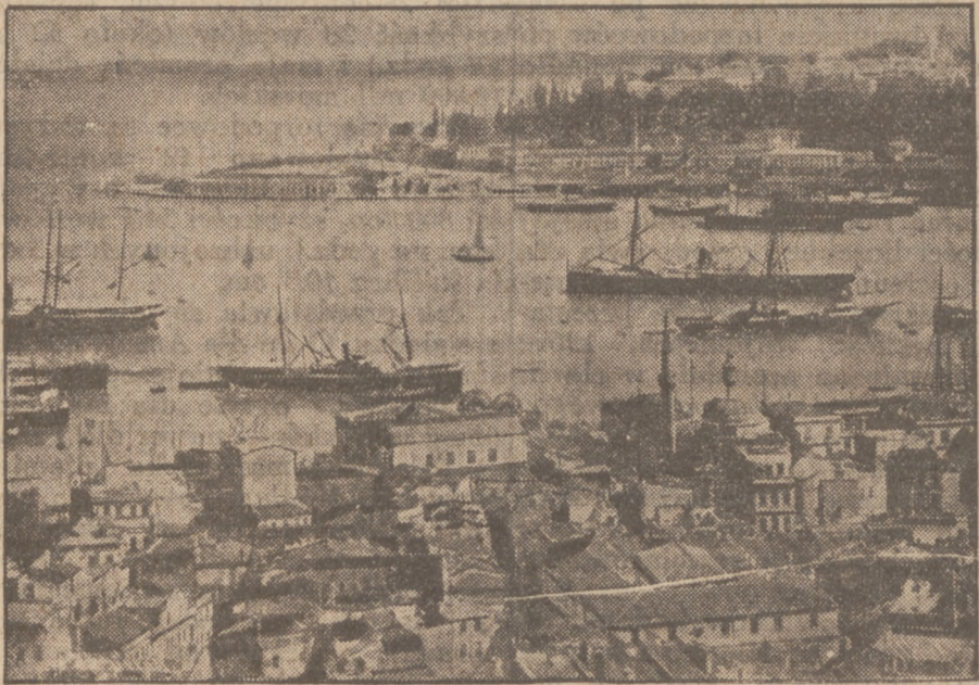
10-LECIE REPUBLIKI TURECKIEJ.

W dniu 29 bm. Turcja obchodzi 10-lecie istnienia republiki a zarazem 10-lecie rządów Kemala-paszy jako jej prezydenta. Na zdjęciach widzimy: Kemala-paszę, obok jego pałac w Angorze, nowej stolicy Turcji, a niżej widok portowej dzielnicy Konstantynopola, zatokę Złoty Róg i na drugim jej brzegu zamieniony dziś na muzeum stary pałac dawnych sułtanów, w głębi zaś na horyzoncie Bosfor.