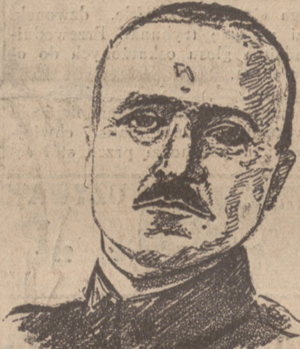
Marszałek Badoglio, dotychczasowy szef sztabu ma zostać ministrem obrony.

Zmiany w gabinecie włoskim. Zniesienie ministerstwa lotnictwa, a tem samem spławienie gen. Balbo.