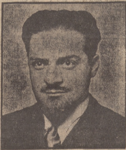
Italo Balbo, marszałek lotnictwa.

KATOWICE, 4.11. — Na zjeździe delegatów wszystkich zakładów „Wspólnoty Interesów” powzięto rezolucję treści następującej: „Zważywszy, że nazwa jednej z hut koncentruje, a mianowicie huta Bismarcka w Wielkich Hajdukach, brzmi prowokacyjnie w stosunku do nas, Polaków, zebrani przedstawiciele wszystkich zakładów „Wspólnoty Interesów” żądają jedomyślnie zmiany nazwy „Huty Bismarcka” na „Hutę Batorego”.