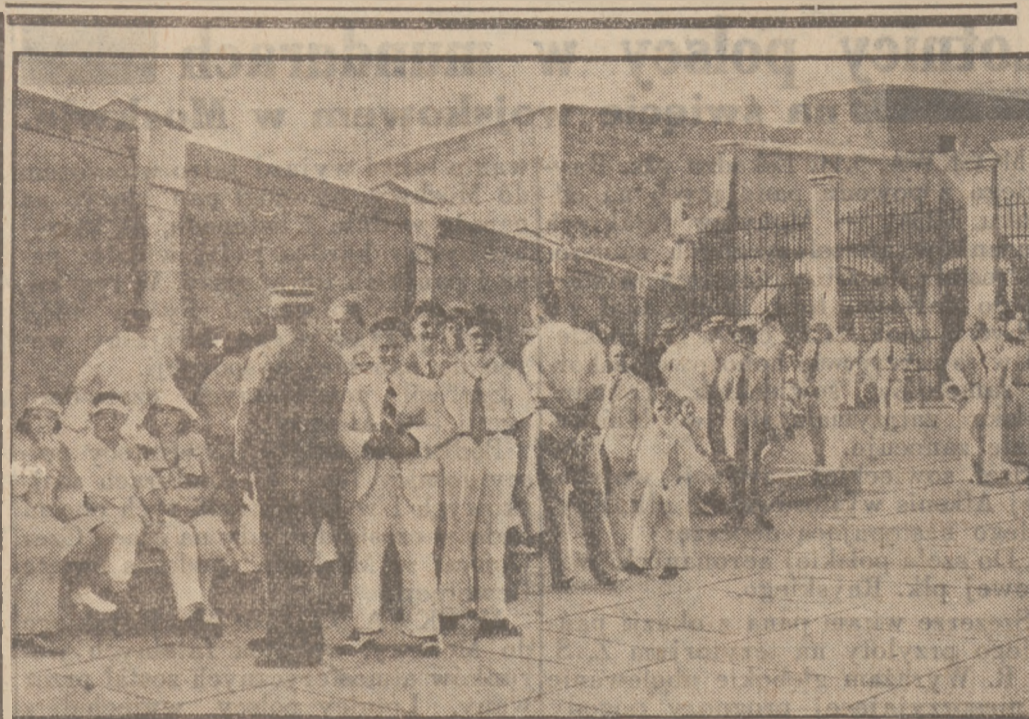
Więźni do niewoli przy zdobyciu przez rewolucjonistów kubańskich hotelu narodowego w Hawannie oficerowie zwolennicy b. rządu Machado przebywają dotąd uwięzieni w jednym z fortów, gdzie — jak to widać na ilustracji — odwiedzają ich rodziny, umiławając czas przymusowej bezczynności.

Mniemamy, że reformie ośrodków towarzyszyć będzie w tym zakresie przeobrażenie opinii szerokich sfer handlowych i przemysłowych, w kierunku całkowicie już pozytywnego ustosunkowania się do „akcji wykorzystania surowców krajowych”.