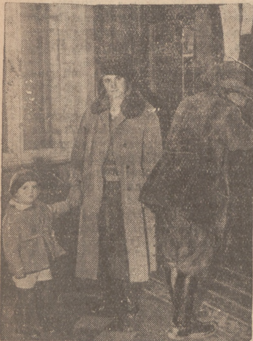
CZY MAŁY LINDBERGH?

Jedno z pism francuskich donosi, że w pobliżu Gembloux w Belgii znajduje się mały chłopczyk nieznanego pochodzenia. Dziecko to od dwu miesięcy rodzina Van den Bosch wychowuje i postanowiła je adoptować.