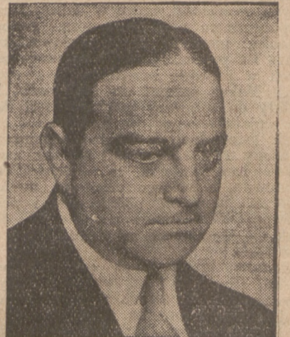
Burmistrzem Nowego Jorku został wybrany po zaciętej walce między stronnictwem demokratycznym a republikańskim republikanin Fiorello LaGuardia, co jest niezmiernie charakterystyczne dla nastrojów politycznych Nowego Jorku, dotychczas głównie fortecy demokratów, gdzie obecny prezydent Roosevelt przed objęciem prezydentury był gubernatorem.

Budienny na czele delegacji armji sowieckiej do Warszawy nie przybędzie.