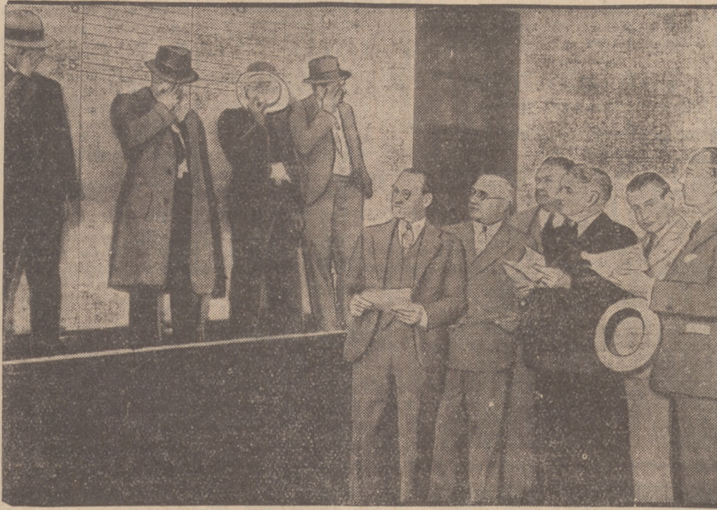
ZBRODNIARZE BOJĄ SIĘ... APARATÓW FOTOGRAFICZNYCH.

Do władz policyjnych w Warszawie wpłynęły skargi w sprawie systematycznych kradzieży na cmentarzach warszawskich. Jak się okazuje — na cmentarzu bródzińskim złodzieje kradną kwiaty, krzyże i... całe pomniki. Przed kilku dniami skradziono bowiem z tego cmentarza dwa pomniki z marmuru. Władze policyjne wszczęły dochodzenia.