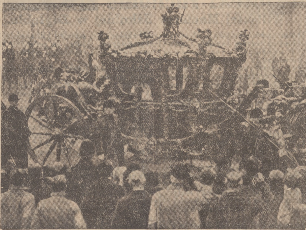
ANGIELSKI KULT TRADYCJI

Nie mamy pretensji do przepowiedzenia przyszłości. Jedno jest dla nas pewne — mamy do czynienia we Francji nie z przesileniem rządowym, lecz z przesileniem państwowym, sięgającym bardzo głęboko w życie tego kraju.