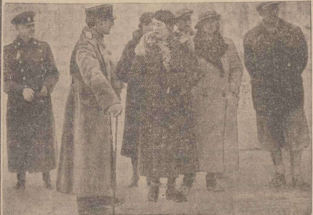
BULGARSKA PARA KRÓLEWSKA,

Tem również objaśnia się fakt, iż koterja Göbbelsa (do której należy również Ley, wódz hitlerowskich związków zawodowych) domaga się zupełnego skasowania krajów (Länder) i absolutnej unifikacji Rzeszy. W ten sposób bowiem udałoby się obezwładnić Göringa, dzisiejszego władcę Prus. Odebrano mu premierostwo pruskie, a wraz z tem policję mundurową i tajną.