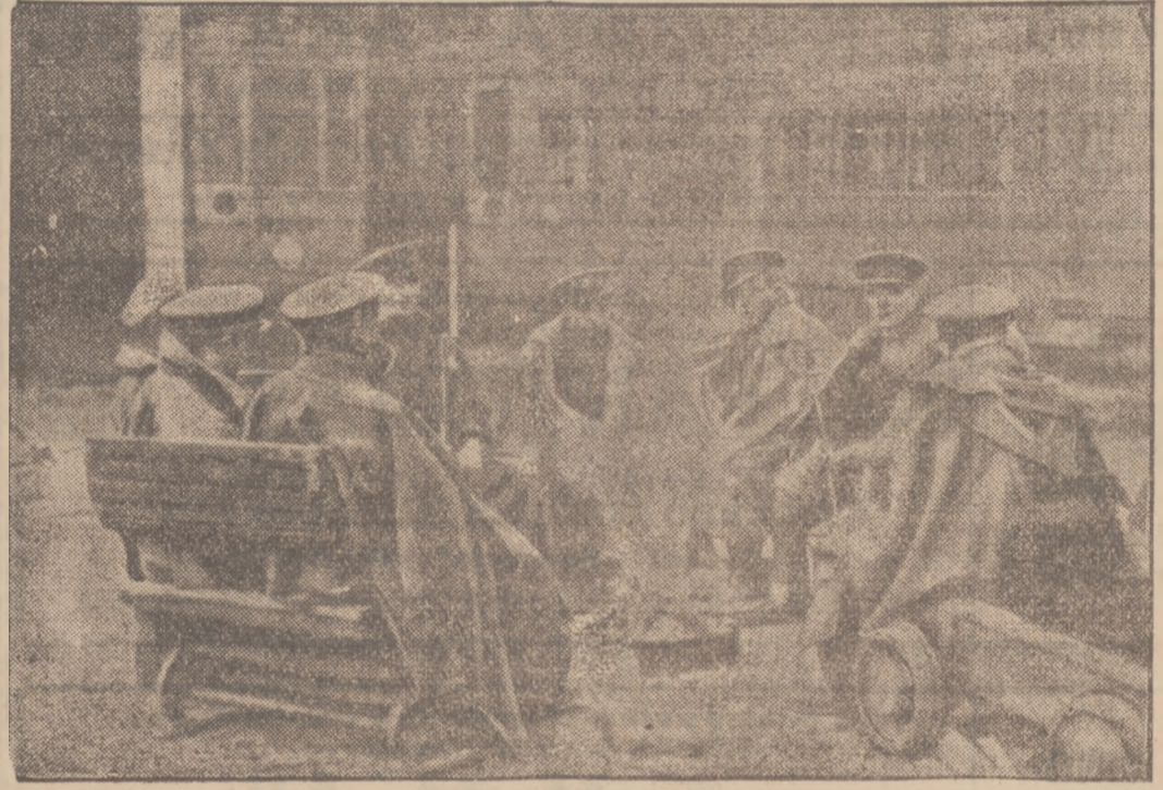
REWOLTA HISPANSKA. Grupa artylerzystów na straży linii kolejowej w Valencji.