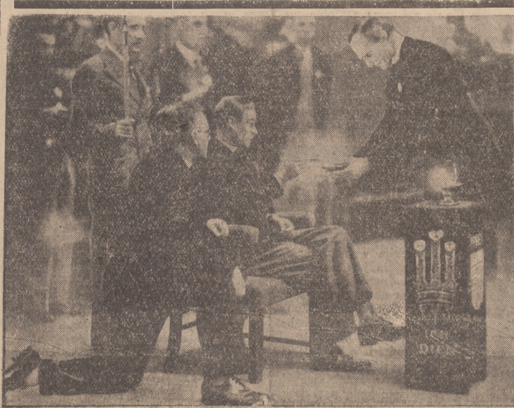
Książę Walji zapala wieczny płomień kaganka, który gorzeć ma dla uczczenia poległych żołnierzy angielskich w czasie wojny.

Rząd brytyjski w ocenie propozycji niemieckiej nie zapomniał o swych zobowiązaniach względem Ligi, a pozatem postępowanie swoje w tej sprawie uzgadnia z postępowaniem rządu francuskiego.