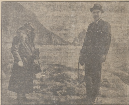
Minister Simon przed wzięciem rzymskiej spowiedzi święta Bożego Narodzenia wraz ze swą małżonką na wyspie Capri.

PARYŻ, 4.1. (PAT). — „Paris Soir” podkreśla, że spotkanie Simona z Mussolinim zostało przerywane o 5.30. Koła dobrane poinformowane łączą ten fakt z wręczeniem francuskiej armii mianości na Walsheim-strasse i nową sytuacją, jaką się wytworzyła wskłaniając tego.