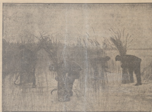
W miejscowościach hagietych rośnie specjalny gatunek siołowa, nadającego się do celów praktycznych. Ściananie tego siołowa odbywa się dopiero zimą, gdy wody i łaguna zmniejsza. Nazywają to siołami na lodzie.

Przyjaciele nie mogli powstrzymać się od śmiechu i wyznali mu nareszcie, że gniazda jaskółcze nieopieane zostały najwyżej jedynej z mielenia fasoli. Kotlety zrobione były z heraniny, a bażant okazał się małym indykiem, którego polano wodką, aby mu nadać charakterystyczny smak dzicyzny... a wino... okazały się fałszowane z jabłek. Od czasu tej wpadki Monselet nie odważył się już występować przeciwko Brillat-Savarin.