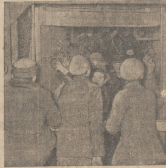
(od lewej): rodziny zasępionych górników oczekują przed wejściem do kopalni w Sosnowcu o znajdujących się w podziemiach strażak. Znaczący widać nadziewany na kopalni Nelson III. Drugim talonem zjeżdża dosyć