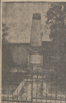
OFIAROM KATASTROFY W OSSEGU.

Wiosnę głośniego pożaru w Ossegu w Czechosłowacji zginało, jak wiadomo, 146 górników. Zostało w dobrych polach tylko 13 górników, których odżyli się unoszący pol- treb. Trumny poległych górników symbolizowały i tych, którzy zostali na dół, — U góry koledzy poległych w żałobnym pochodzie.