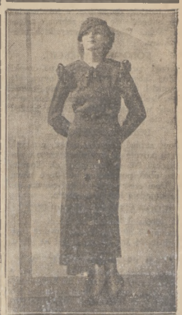
Największy model wiosennej sukni wesołej.

NA KOMITET DOYWM. DZIECI W SZKOLACH: M. K. składa 20 (dwadzieścia) zł.