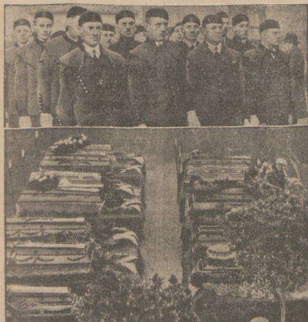
POGRZEŁ OFIAR KATASTROFY W KOPALNI NELSON III W OSSEGU.

Wiosnę głośniego pożaru w Ossegu w Czechosłowacji zginało, jak wiadomo, 146 górników. Zostało w dobrych polach tylko 13 górników, których odżyli się unoszący pol- treb. Trumny poległych górników symbolizowały i tych, którzy zostali na dół, — U góry koledzy poległych w żałobnym pochodzie.