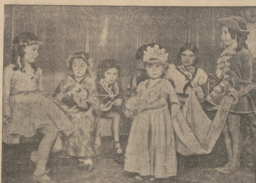
NA BALU KOSIJUMOWYM. Królowa i jej małżonka, mała japońska, elf i osnowy kapłanek wyznały sobie spotkanie na balu, który wydał księżów króla dla przyjaciół swych dzieci.