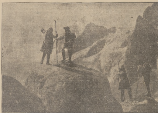
Francuska wytwórnia Cine - Alliance - Film montuje obecnie film p.t. „Król Montbla- nu”, który między innymi przedstawia przebieg Napoleona przez Algier. Na ilustracji jedna ze scen tego filmu.

przypomina, iż w myśl art. 269 Ustawy o ubezpieczeniu społecznym, pra- codawca, który w przepisany terminie nie dopełni obowiązku zgłosze- nia zatrudnionych u niego pracowników umysłowych i fizycznych, po- dlega karze grzywny do 500 zł.