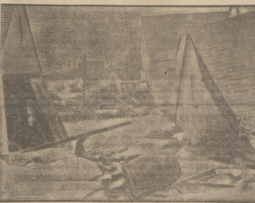
W poniedziałek stycznia w Kalifornii szedł orkan. Oto fragment z przedmieścia Los Angeles po przejściu orkana. Pod gruzami domów znalazło śmierć 22 osoby.

Na przejeździe kolejowym w Karlinie wsiach pod Pabianicami, miało miejsce zabójstwo z przyczyn zgroła niezwykłych. Droga zdążył wóz chłopaki, do którego