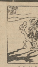
PODRÓŻ POSŁUŻNA PRZEZ SAHARĘ. Spowitem.