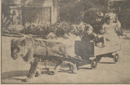
ZAMIAST KUCA LEW.

Masoneria amerykańska naskutek kryzysu gospodarczego uciepiała znacznie. Wolnomularstwa w Stanach Zjedn. obejmują dziś 16,340 162 o 3,061,329 członków, co oznacza utratę 143,366 członków w ciągu jednego roku. Masoneria w Kanadzie posiada 1,379 162 o 201,454 członków, a więc wykazuje również obniżkę 4,705 członków.