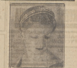
NA WIECZOR. Najmłodniejsza fryzura ze złota przepaska

Tak twierdzą o tem stare kroniki. A więc w roku 662 morze Adriatyckie zamrzarło i w tym roku szedł na drogą przeszedł w 1346 roku łagwny wenecki moneta służył jako ślizgawki w 1423 r. druga zima panowała w całej Europie, tak, iż porażały się w 1695 roku Amal XII mógł się przeprawić z wsią armją przez mały Bieł po lodzie; rok 1694 zamrzarł jak tak wielkimi mrozami, iż prawie wyginęło masowo; w 1740 r. podobnie mrozy i śniegi porażały gospodarstwa w Czechach, gdzie zginęło też zimny śnieg owoce, 4.000 koni i wołów, 5.000 koni i 1.000 świń. W porównaniu z temi klęskami, zimny nie mamy od kilkadziesiąt lat są dość łagodne.