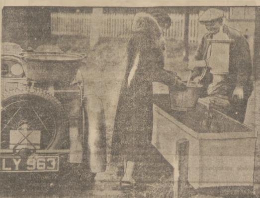
KLĘSKA POSICHY W ANGLI. Każde polacie kraju są haż wody i zrzeczenia automobilistów zorganizowały ochotniczą służbę pomocniczą w dostarczeniu wody do odleglejszych wsi.