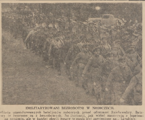
Defilada umundurowanych batalionów robotnych przed oficerami Reichsheery. Bataliony te tworzone są z bezrobotnych. Na ilustracji, jak widać maszynę z łopatkami na rotacjach, ale w każdej chwili łopatki te mogą być zamienione na... karabiny.