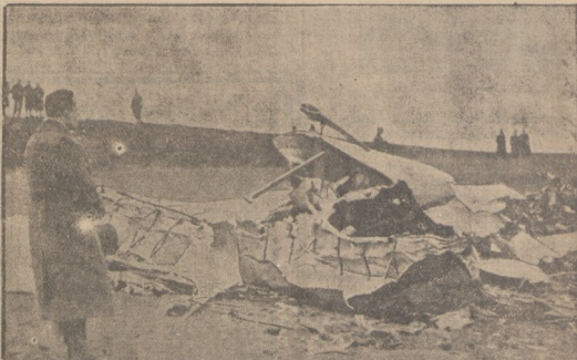
Francuskie ministerstwo lotnictwa ogłosiło sprawozdanie o katastrofie samolotowej pod Corbagny, w której śmierć znalazło 10 osób, w tym gubernator Indochin i szereg wyższych urzędników. Przyczyną wypadku było nagrowodnienie uderzenie pioruna w samolot. — Na ilustracji z lewej strony: francuski samolot — obrotowy „Simaradi” przed startem na lotnisku. Z prawej: francuski minister lotnictwa Cot przybył na miejsce katastrofy samolotu.