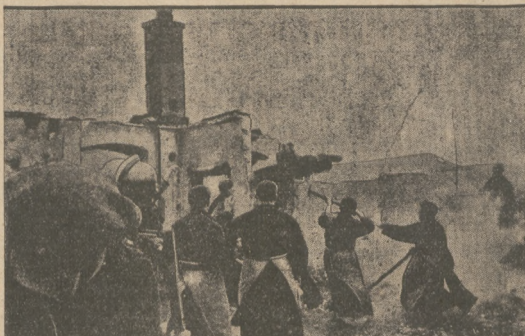
ZAKONNICZY W ROLI STRAŻAKÓW. W tych dniach w klasztorze O. O. Franciszkanów w Waldtrübach (Niemcy Zachodnie) wybuchł wielki pożar, który strawił część zabudowań klasztornych. Na dachu zakonnicy przy akcji ratunkowej.