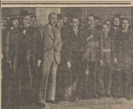
„CZŁOBIKI” HISPANSKIEGO POWSTANIA MONARCHYSTYCZNEGO PRZED SADEM. Przed sądem najwyższym w Madrycie rozpoczęła się rozprawa przeciwko oficerom, którzy pod wodzą gen. Sanjurjo usiłowali dokonać przewrotu monarchistycznego. Na zdjęciu oskarżeni oczekują na rozpoznanie rozprawy.

stosowaliśmy wobec nich należyty nacisk. Preobrażński napisał obecnie oświadczenia, w którym znowu się upokarza. Zwroćmy nań baczną uwagę, aby jego czyny nie były sprzeczne ze słowami! — zakończył Kaganowicz.