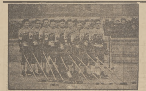
Działka holenderska Saskatoon-Quakers — reprezentuje Kanadę na towarzyszym mistrzostwach świata rozgrywanych w Mediolanie — Italia. Jakkolwiek kanadyjscy urobili się za osobami za niepokonanych, w rozgrywkach na kontynencie ponieśli kilka porażek, które poważnie podważyli ich aspiracje w hokeju.