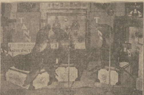
Trzy piękne foki „koncertują” przed mikrofonem w studio radiowym.

Wszystcy trzej napastnicy zostali przez policję chwilowo zatrzymani, gdyż odpowiadają za wymuszenie pieniędzy przez zycim gróźb.