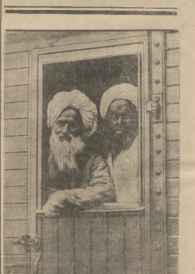
POCIĄG PIELGRZYMÓW DO MEKLI. Według przestarzałego zwyczaju do Świętego Dła maholnien miasta Mekli według starych niedzieleznie (tymy wierszy). Tyko to zażnają korzystać przy komunikacji z pociągami wiozącymi waga kony, natomiast wazet parotriarbowe maholnienistcy używają wagonów kolejowych.

KARTELIJACJA JUTY. Jak wiadomo, kar-kolnia produkcyjna w Polsce jest już do przeszło 2 lat skartelizowana. Całe zapotrzebowanie na kwasowy paskiwa w kraju 6 skartelizowanej fabryki tego przemysłu. Ostatnio utworzony został w Łodzi kartel na prowadzenie odbiorców materiałów budowlanych używających. Kartel ten jest na rynku do przeważającego monopolu, gdyż cała produkcja używających w tych warunkach pierwszeństwem posiadaniem powojennej fabryki uromowienie podaż, która wpłynęła na zwyżkę cen „kalkulacji” cen surowców i towarów, z których o blisko 30%, ceny tkanin nietylko nie uległy zmianie w tym stonku, ale zostały nawet podwyższone. Zaczęły przylem natężyć, zaległości mieszczą zakłady, z których w razie wazującej mierze wady uboższej ludności, co oznacza, przy zwyżce cen odbijają się również na konsumpcji.