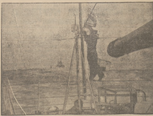
MANEWRY FLOTY ANGIELSKIEJ. Oznaczek z manewrów Floty angielskiej na morzu Śródziemnym, które odbyły się wódfó wyjątkowo nieprzeżyjących warunków podczas niezwykle silnej burzy.