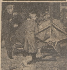
Podczas krwawych zajęć w Paryżu w nocy z 6 na 7 stycznia demonstranci przewrócili wielką latarnię uliczną, używając jej jako barykady.

O godz. 7 wieczorem w Poznaniu szalała gwałtowna wichura, a od godziny 10 wieczorem w Warszawie. przewalać szczyty i dachy.