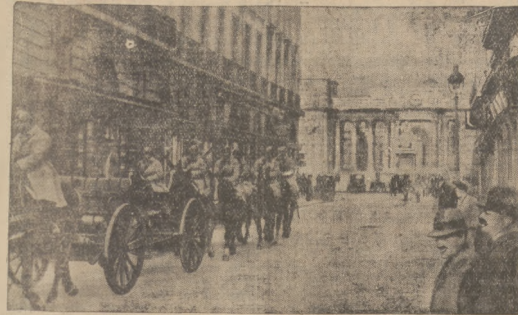
Dwie tysiące wojaków sprowadzono do Paryża w czasie rozruchów. Oto artylerja w centrum miasta.