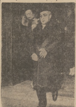
CHIAPPE h. prefekt policy Paryża, którego dymisja między innymi spowodowała rozruchy w Paryżu.

Jasne odpowiedzi na to pytanie w tej chwili jeszcze udzielić nie można. Ulica, która chce zaprowadzić parlament na Tarpejską skalę, składa się z bardzo różnych elementów: rojalistów, faszystów spod znaku Valois, grupy kombatanckie, o niezbyt ściśle określonym obliczu ideowym. — Wszystko to idzie dziś w zwariowanym szuku, ogarniając falą rewolucyjną opinię społeczeństwa, które coraz bardziej utwierdza się w przekonaniu,