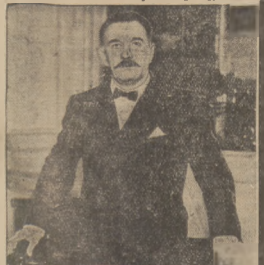
Nowy Prefekt Policy Paryskiej. Nowy prefekt policy paryskiej, Bonelowy, który zastąpił na miejsce odwołanego pref. Chiappe'a, kierował oddziałem akcji policyjnej przeciw demagogom, narzucając im na zmianę ministerstwa spraw wewnętrznych.

Wypadki, rozgrywane się w Paryżu, są niewątpliwie dowodem wielkich przeobrażeń moralnych, ideowych i politycznych, jakie następują w tym kraju. Przelana krew w nocy z 6 na 7 lutego zbył mocno niewol-