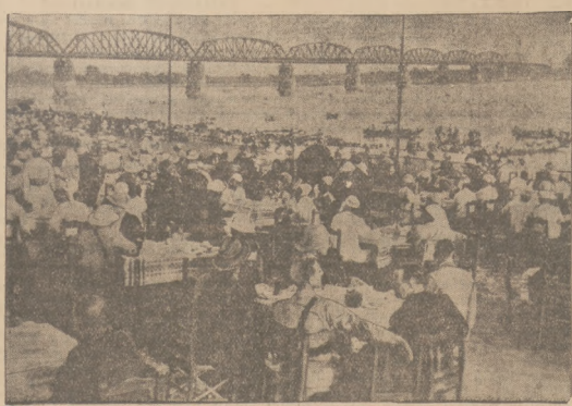
NOWY MOST-OLBRZYM W INDIACHI. W tych dniach oddany został do użytku olbrzymi most kolejowy na rzecze Trawadi w Birnie, skonstruowany przez inżynierów angielskich.

Tapety sluzace do ogrzewania pokoiow armazementu i zastanowione zostaly pozat pierwszy w Anglii. Znajduja się one juz w gospodach w postaci rolnik o szerokości 1 m. i grubości 1 mm. Są one sporządzone ze specjalnej masy, nagrzewającej się pod wpływem prądu elektrycznego. Wytworzone gumkami, łapią nagrzewającą masę, która się do prądu o sile od 100 do 115 wolt, od 200 do 250 wolt. Przy mniejszej powierzchni, tapety wystarczają do ogrzania tej własności prądu z przewodników oświetleniowych. Tapety wytrzymały temperaturę do 32-35 st.